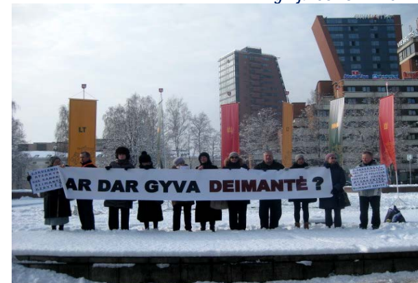
Klaipėdos visuomenininkai reiškia protestą prieš supūvusią valdžios sistemą bei smurtą Garliavoje, Kauno rajone, įvykdytą 2012 m. gegužės 17 d. ir klausia Lietuvos pedofilinę valdžią: