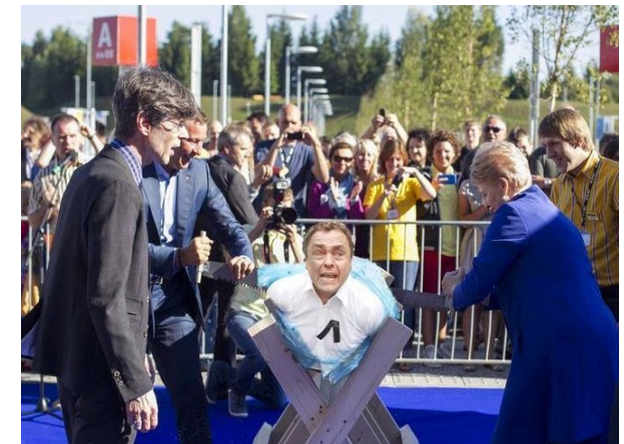
Už Lietuvą, vyrai! Be iškrėpėlių, be genderlapių!