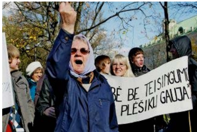
Lietuvos pensininkai solidarizuojasi su Graikijos pensininkais

Gailiausiai trečioji grupė - ta laimingoji jaunimo dalis, kurie turi darbą. Matydami vykdomas socialinės apsaugos sistemos pertvarkas, jie puikiai supranta, kad valstybė yra nepatikima. Nėra jokios garantijos, kad visą gyvenimą savo mokesčiais prisidedant prie pensijų, ši „investicija“ atsipirka. Tad, kad ir kaip vertintume Graikijos visuomenės požiūrį, veiksmus ir bendrą situaciją, tikrai galima suprasti tuos žmones, kurie eilinį kartą stabdo šalies gyvenimą, kad išėję į gatves su plakatais rankose gintų savo socialines garantijas. O mums belieka palinkėti sau ir pasimokyti iš Graikijos klaidų, kad netektų atsidurti jų situacijoje. Rūta GELEŽINĖ