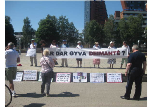
Klaipėdos visuomenininkai reiškia protestą prieš supūvusių valdžios sistemą bei smurtą Garliavoje, Kauno rajone, įvykdytą 2012 m. gegužės 17 d.